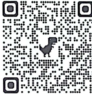
Formato DPA para Curriculum Vitae